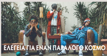
ΕΛΕΓΕΙΑ ΓΙΑ ΕΝΑΝ ΠΑΡΑΛΟΓΟ ΚΟΣΜΟ