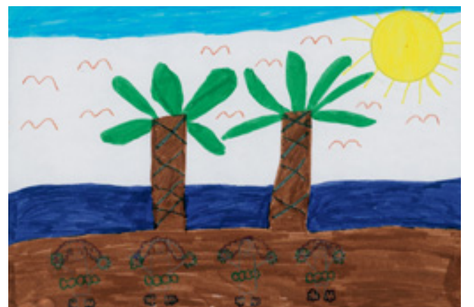
Η πανέρμοφη Χαβάη με τις χορεύτριές της, Χούλα - Χούλα. Γιάννης Γλυνός - Τάξη Γ1

‘Επίσης το ποσό των 1500 ευρώ πρόσφερε ο δήμος μας σε κάθε σχολείο για τη συγκρότηση ή τον εμπλουτισμό της σχολικής βιβλιοθήκης. Τα χρήματα αυτά προέρχονται από την αξιοποίηση του ακινήτου που είναι δωρεά της οικογένειας Κεφαλληνού. Εμείς οι γονείς ευχαριστούμε θερμά. Όμως επισημαίνουμε ότι μια σχολική βιβλιοθήκη δεν θα είναι αποτελεσματική αν δεν υπάρχει το κατάλληλο πρόσωπο για να τη λειτουργήσει και να προσελκύσει το ενδιαφέρον των παιδιών για διάβασμα.