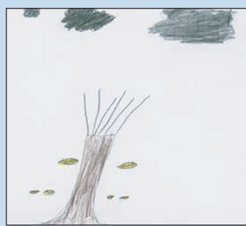
Το φθινόπωρο τα φύλλα των δέντρων γίνονται κίτρινα και πέφτουν. Τα σύννεφα είναι γκρι και ο ήλιος δεν φαίνεται