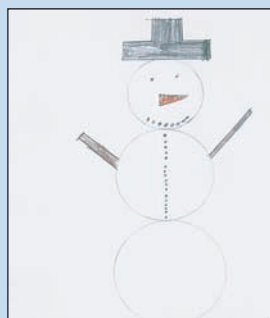
Το χειμώνα οι άνθρωποι φτιάχνουν χιονάνθρωπους και στολίζουν χριστουγεννιάτικο δέντρο