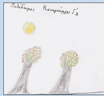
Την άνοιξη ανθίζουν τα λουλούδια τα δέντρα και ο ήλιος είναι λαμπερός