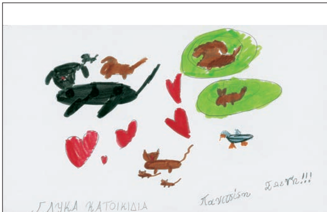
Γλυκά κατοικίδια. Από τη μαθήτριά Ελένη Παντισοδη, Β' τάξη