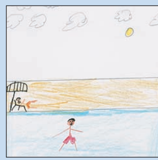
Το καλοκαίρι τα παιδιά με τους γονείς τους πάνε για κολύμπι στη θάλασσα. Ο ήλιος είναι λαμπερός τα σύννεφα λίγα